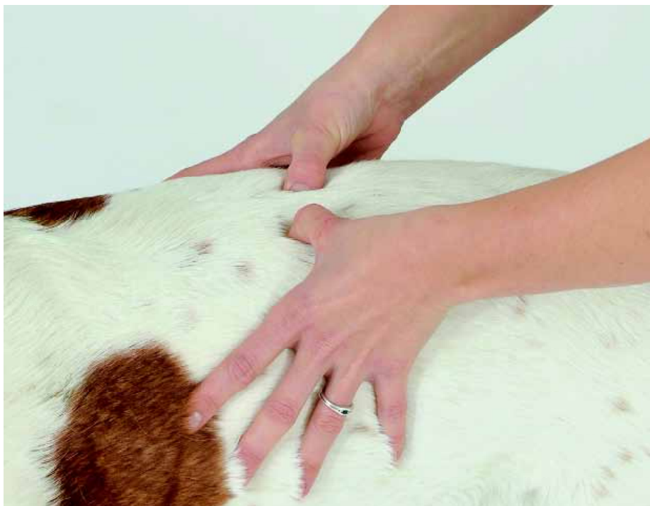
Orthomaneel lichamelijk onderzoek van de rug bij een hond.